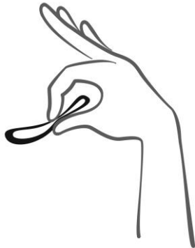
Rycina 2 Ścisnąć system