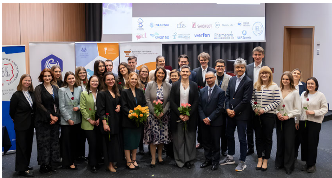
▲ Konkurs na najlepsze prace magisterskie Wydziału Farmaceutycznego rozstrzygnięty

– Konkurs jest świętem na Wydziale Farmaceutycznym, a duża część wyników stanowiących przedmiot prac dyplomowych jest potem przedmiotem publikacji naukowych.